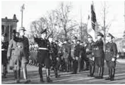
Reichsarzt SS Ernst Robert Grawitz als geschäftsführender Präsident des DRK (in schwarzer Uniform mit erhobenem Arm) neben Oberbürgermeister Julius Lippert bei einer DRK-Kundgebung im Lustgarten, Berlin am 13.11.1938.

Es geht eben nicht darum, eine singuläre „Peinlichkeit“ aus der Welt zu schaffen oder einen „Schandfleck“ zu beseitigen. Vielmehr muss man sich die Frage stellen, warum besonders in der älteren Generation diese Idee bzw. der Wunsch nach Verdrängung und Elimination in einer solchen Form verhaftet ist. Die DGHO e.V. ist davon überzeugt, dass ein Bewältigungsmuster in Form eines solchen „Wunsches nach Tilgung“ einer angemessenen Vergangenheitsbewältigung der Fachgesellschaft – auch und besonders vor dem Hintergrund der Gräueltaten von Grawitz – nicht gerecht wird. Haben die Forschungen der letzten Jahrzehnte ein schärferes Hinschauen und Differenzieren der mittleren Generation gelehrt? Demgegenüber mag es in der jüngsten Generation inzwischen nicht wenige geben, denen die „Schuldbekennnisse“ und „Erinnerungs-Imperative“ auf die Nerven gehen. Tatsächlich gibt es ja keinerlei Gewähr, daß wir durch die permanente Abgrenzung von den Irrtümern und Misstaten der Eltern und Großeltern automatisch bessere Menschen würden und auf der „richtigen“ Seite stünden, ganz im Gegenteil: Konkurrenz, Neid, Strebertum, verletztes Nationalgefühl, Ausgrenzung etc. sind gegenwärtig wie eh und je. Gerade der Artikel über die Historizität der Ehrenmitgliedschaft hat die dauerhafte anthropologische Gefährdung des Menschen durch sein Streben nach excellencia deutlich zu